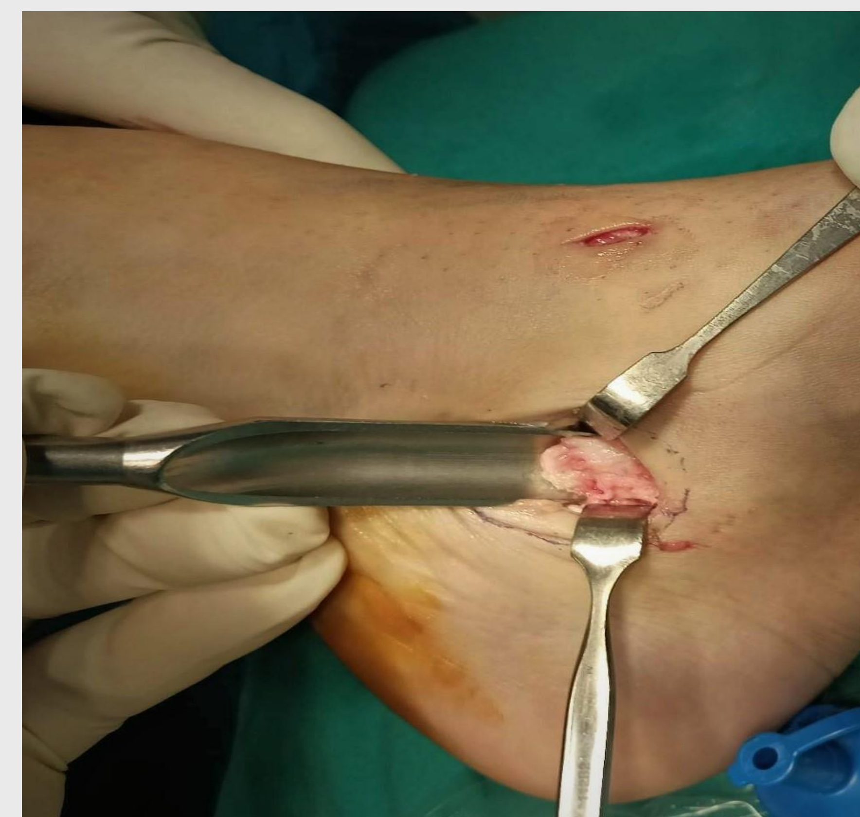
Εικόνα 3. Διεχειρητική φωτογραφία κατά την αφαίρεση του συνοστεομένου οσταρίου