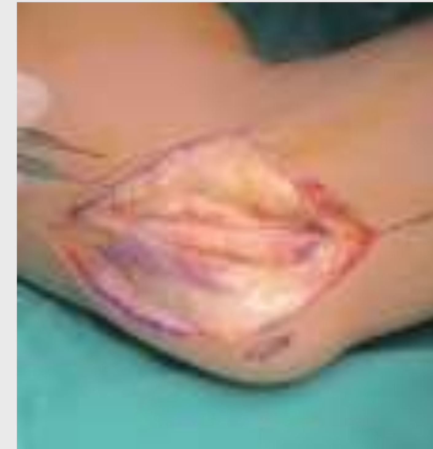
Εικόνα 2. Διάνοιξη ωλενίου σωλήνα στον αγκώνα και απελευθέρωση του νεύρου κεντρικά και περιφερικά