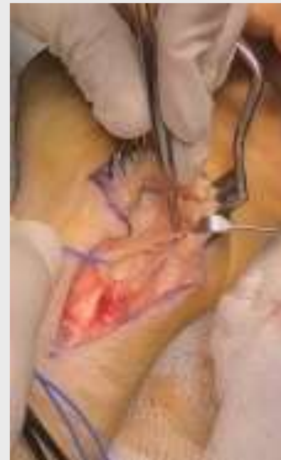
Εικόνα 3. Ευρεία παρασκευή του ωλενίου νεύρου με διάνοιξη του καναλιού του Guyon και αναγνώριση και απελευθέρωση του διχασμού του νεύρου