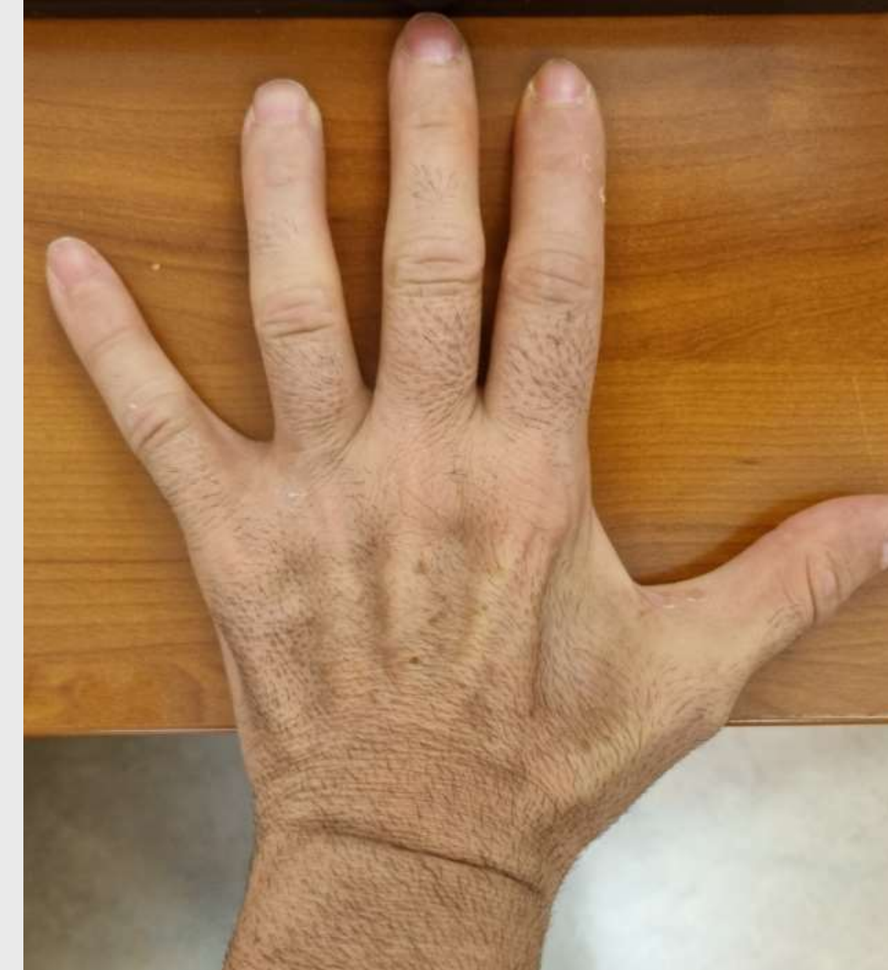
Εικόνα 1. Ατροφία μεσώστων μυών και αδυναμία προσαγωγής του μικρού δακτύλου.

Ioannis M. Nikolopoulos Md, MSc Metropolitan Hospital, N. Faliro Email: orthomis@gmail.com Phone: 0030 693 2525 406 Website: www.totalorthocare.gr