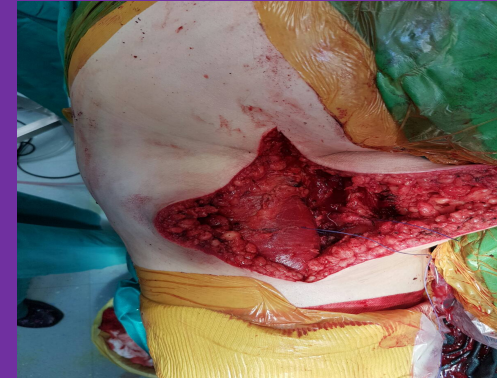
Εικόνα 3: Φωτογραφία κατά την χειρουργική εκτομή του όγκου

ΑΠΟΤΕΛΕΣΜΑΤΑ: Πραγματοποιήθηκε ευρεία χειρουργική αφαίρεση του όγκου. Η ιστολογική εξέταση έδειξε πλειόμορφο λιποσάρκωμα. Ο ασθενής έλαβε μετεγχειρητική ακτινοβολία και χημειοθεραπεία, σύμφωνα με τις συστάσεις του ογκολογικού συμβουλίου. Μέχρι στιγμής δεν έχει εκδηλώσει τοπική υποτροπή του όγκου ή μετάσταση.