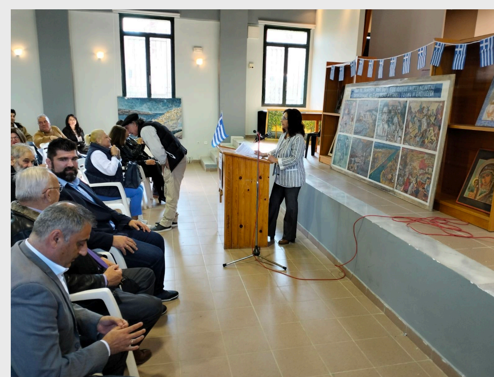
Εικόνα 3. Επετειακή εκδήλωση εορτασμού 25 ης Μαρτίου (2023)

Το δικαίωμα στην εκπαίδευση είναι αναφαίρετο δικαίωμα για τους κρατούμενους, ενώ η σύγχρονη σωφρονιστική πολιτική, αναγνωρίζει τον καταλυτικό ρόλο της εκπαίδευσης στην υγιή επανένταξη του έγκλειστου στην κοινωνία (Bayliss, 2013) Το Δημόσιο ΙΕΚ Κασσάνδρας παίζει σημαντικό ρόλο στον τομέα αυτό. Η εκπαίδευση τις φυλακές συναντά ιδιαίτερες δυσκολίες, καθώς υλοποιείται σε ένα ίδρυμα ολοκληρωτικού χαρακτήρα (Goffman, 1961) με τα «δεινά του εγκλεισμού» (Toch, 1975) Ο εκπαιδευόμενος για να μάθει, χρειάζεται ασφαλές περιβάλλον, να δεσμευθεί, να αισθανθεί ότι η εκπαίδευση γίνεται γέφυρα ανάμεσα σε εκείνον και την κοινωνία, με αποτέλεσμα τη μείωση της υποτροπής και την κοινωνική επανένταξη (Giles, 2016).