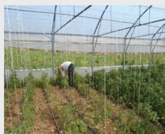
Εικόνα 2. Εφαρμογή γνώσεων στο αγρόκτημα