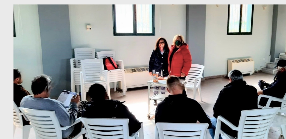
Εικόνα 4. Από τα μαθήματα δημιουργικής γραφής

Το ΔΙΕΚ Κασσάνδρας λειτουργεί από το 2014 και είναι το μοναδικό δημόσιο ΙΕΚ της χώρας σε Αγροτική Φυλακή. Διδάσκουν ωρομίσθιοι εκπαιδευτικοί που έρχονται από τον «έξω κόσμο» ως Α' εκπαιδευτές/τριες και προσλαμβάνονται από το Μητρώο Εκπαιδευτών Δ.ΙΕΚ. Στην περίπτωση του ΔΙΕΚ Κασσάνδρας, όμως, στην εκπαιδευτική διαδικασία εμπλέκονται ενεργητικά σωφρονιστικοί υπάλληλοι της φυλακής: γεωπόνοι, μηχανολόγοι, τυροκόμοι, μάγειρες, κ.ά., εγγεγραμμένοι στο Μητρώο Εκπαιδευτών Δ.ΙΕΚ, οι οποίοι προσλαμβάνονται ως Β' Εκπαιδευτές, συνοδεύοντας τους Α' εκπαιδευτικούς πρωτίστως για λόγους ασφαλείας. Αρκετοί σωφρονιστικοί υπάλληλοι εγγράφονται ως σπουδαστές, εκπαιδεύονται ισότιμα μαζί με τους κρατούμενους συμφοιτητές τους, με θετικά αποτελέσματα σε στάσεις, αντιλήψεις, συμπεριφορές εκατέρωθεν, όσο και απέναντι στη μάθηση.